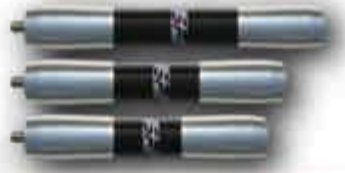
HCF Extension 3/4/5 pouces