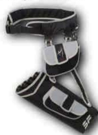
Très résistant, quatre tubes, deux poches et ceinture grand confort