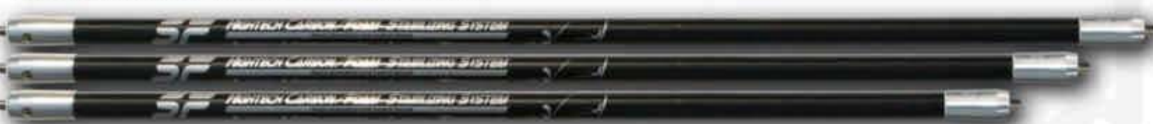
HCF Central 26/28/30 pouces