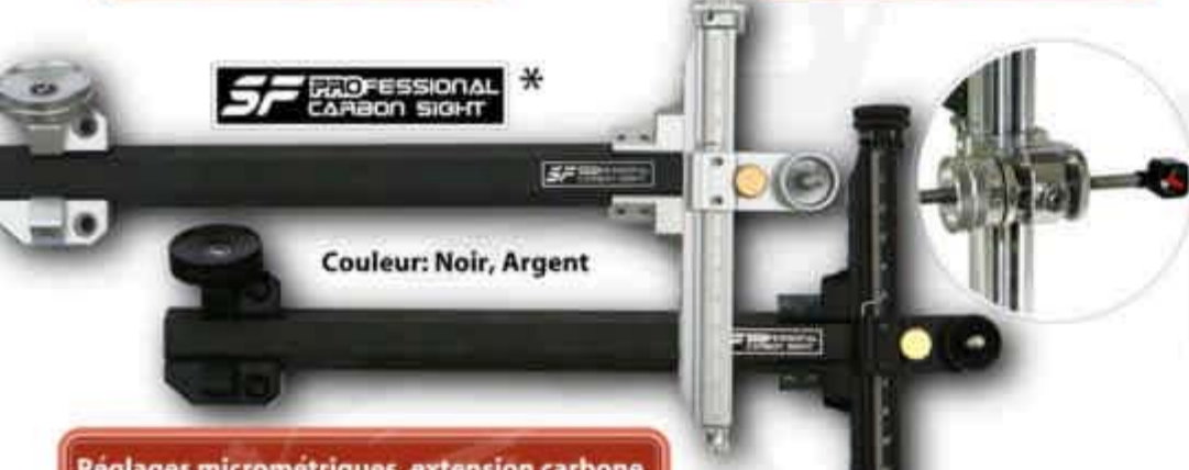
Couleur: Noir, Argent

Réglages micrométriques, extension carbone, modèles droitier et gaucher, livré avec housse