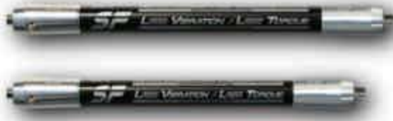
HCF Latéral 10/12 pouces