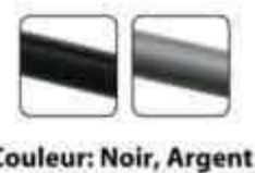
Couleur: Noir, Argent