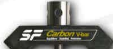
Angle horizontal 35°/40°